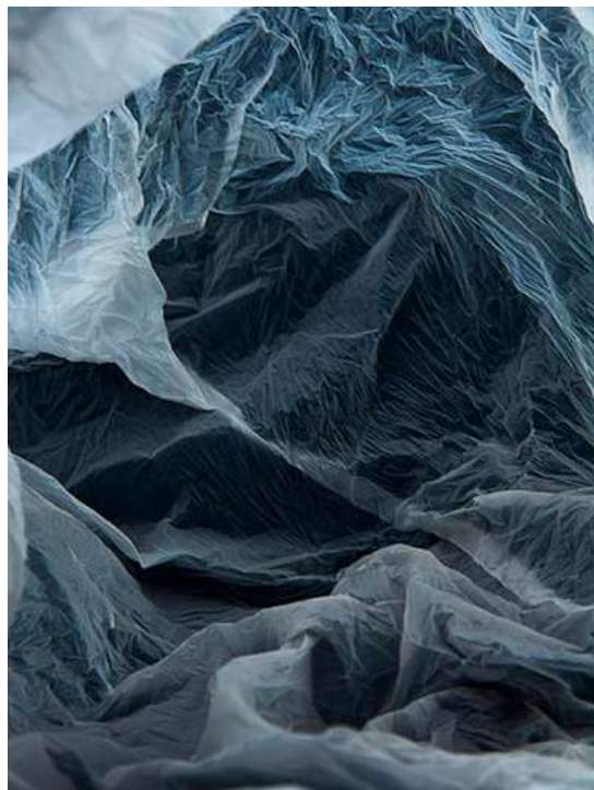
PLASTIC LANDSCAPE BY VILDE J. ROFSEN.