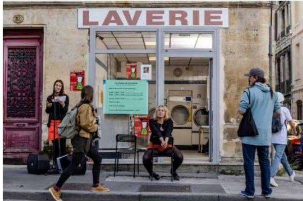
Devant la laverie du 34 du cours de la Somme.

Cette fois, en accord avec plusieurs commerçants du périmètre défini, elles viennent avec des « textes égarés » – qui ont été écartés d'une de leurs créations – surprendre les gens dans leur